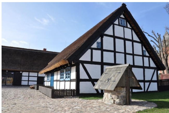
Zrekonstruowana historyczna Zagroda Jamneńska z XIX w..