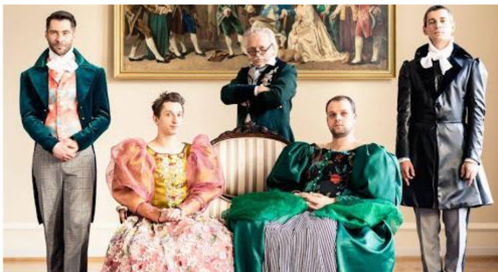
„Śluby panięskie” na 10. edycji Festiwalu Koszalińskie Konfrontacje Młodych „m-teatr” 2019