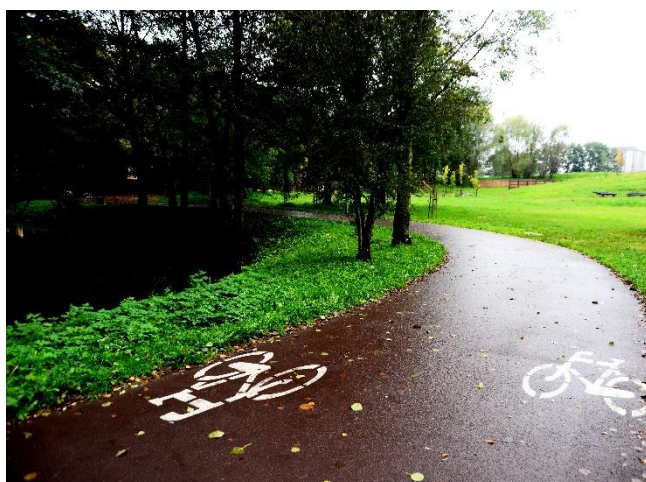
Nowe ścieżki/trasy rowerowe w Koszalinie