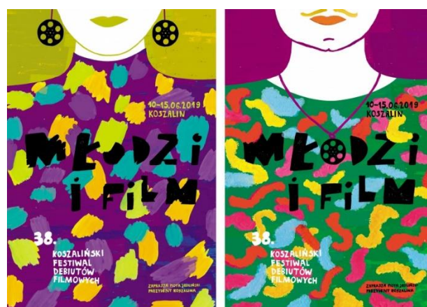
Koszaliński Festiwal Debiutów filmowych „Młodzi i Film”