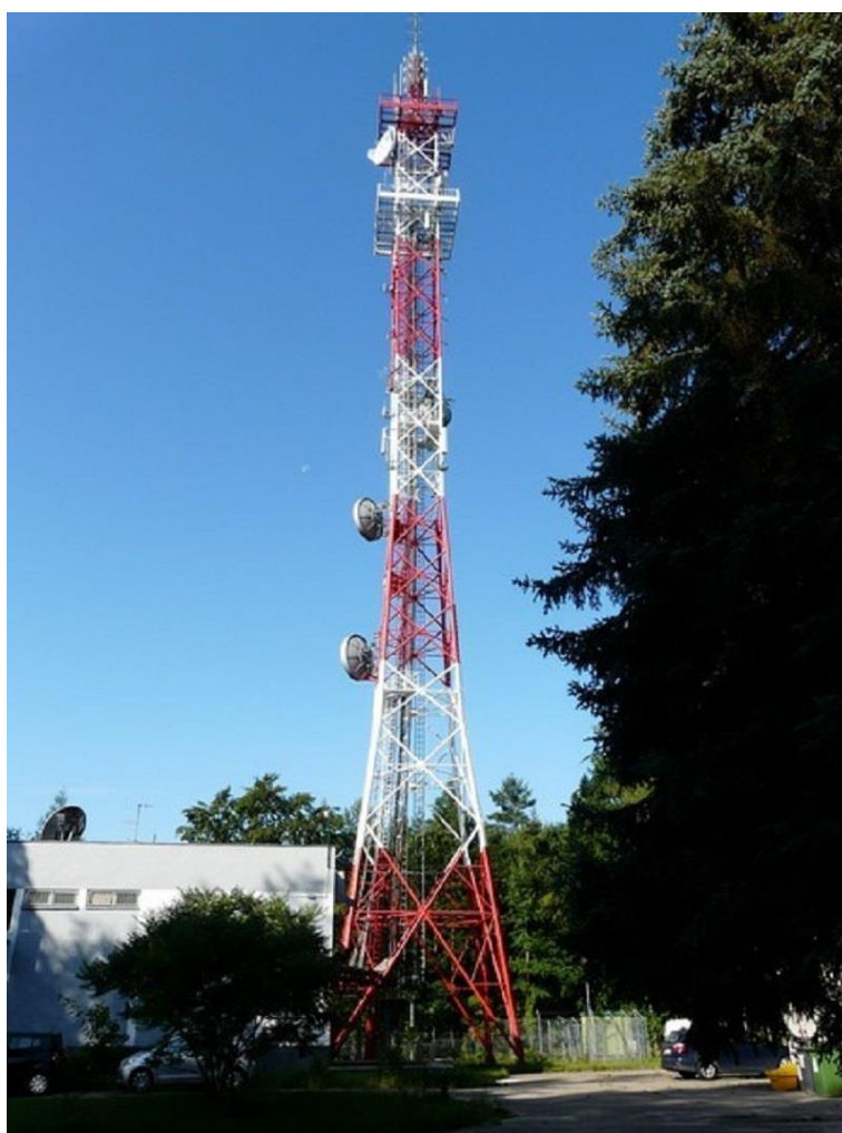
Fot. 1. RTON Koszalin / Góra Chelmska – widok obiektu