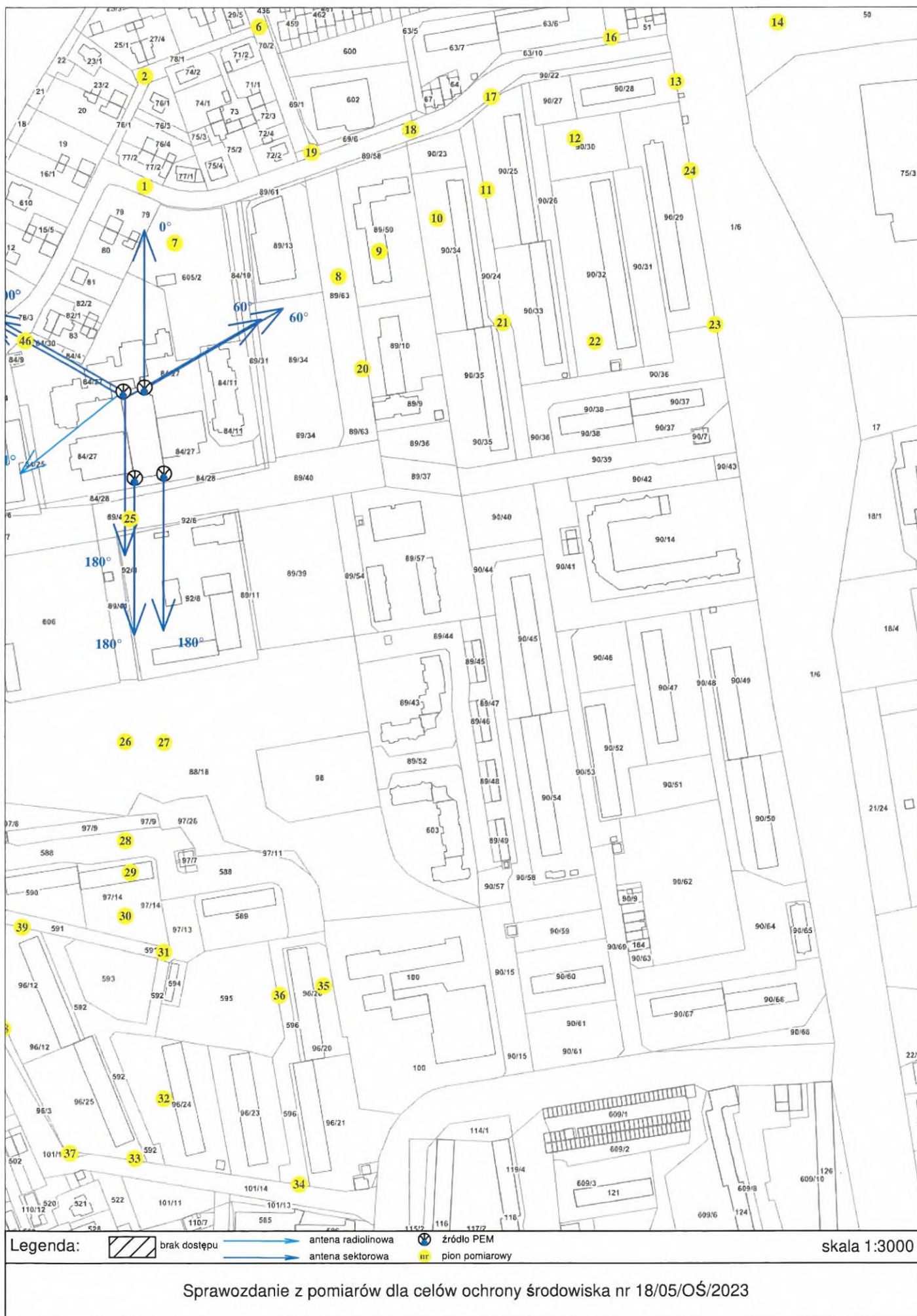
Rys. 3 Lokalizacja pionów pomiarowych