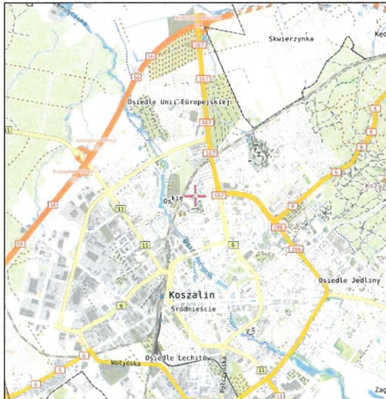
Rys. 1 Lokalizacja badanego obiektu