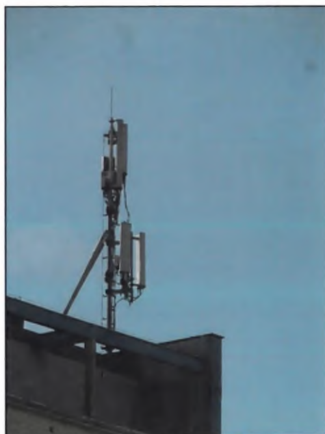
Rys. 3 Widok badanego obiektu