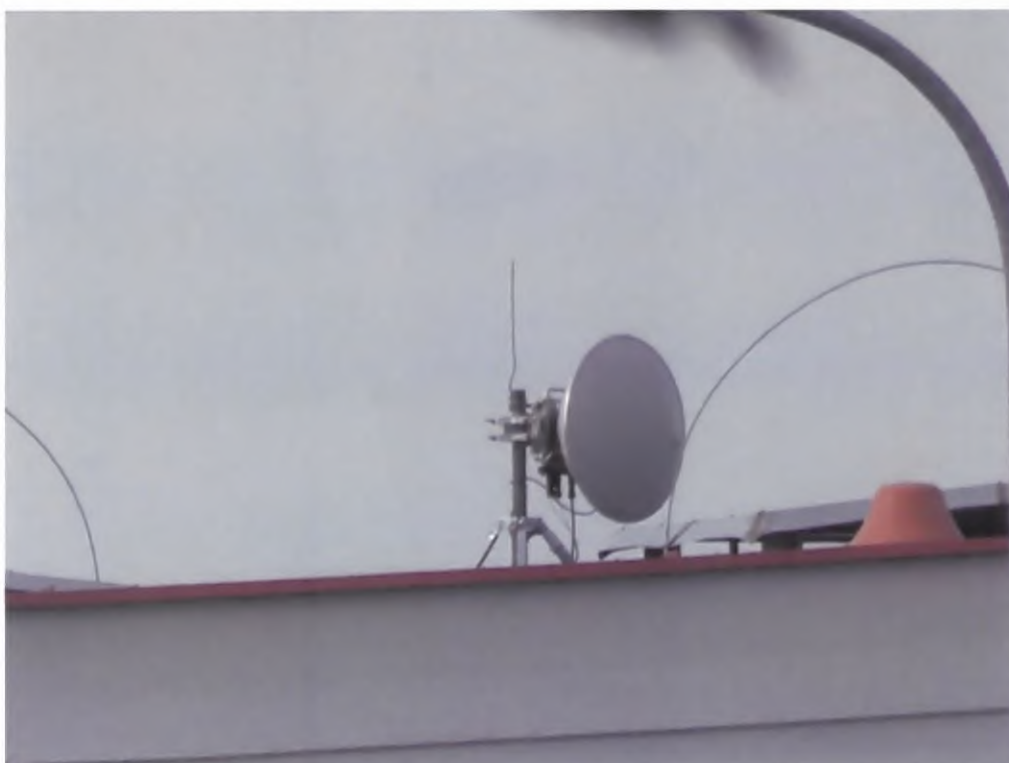
Widok instalacji radiokomunikacyjnej Stacja Netia KOSZB090 - KOSZM00033 Koszalin, ul. Bojowników o Wolność i Demokrację 24.