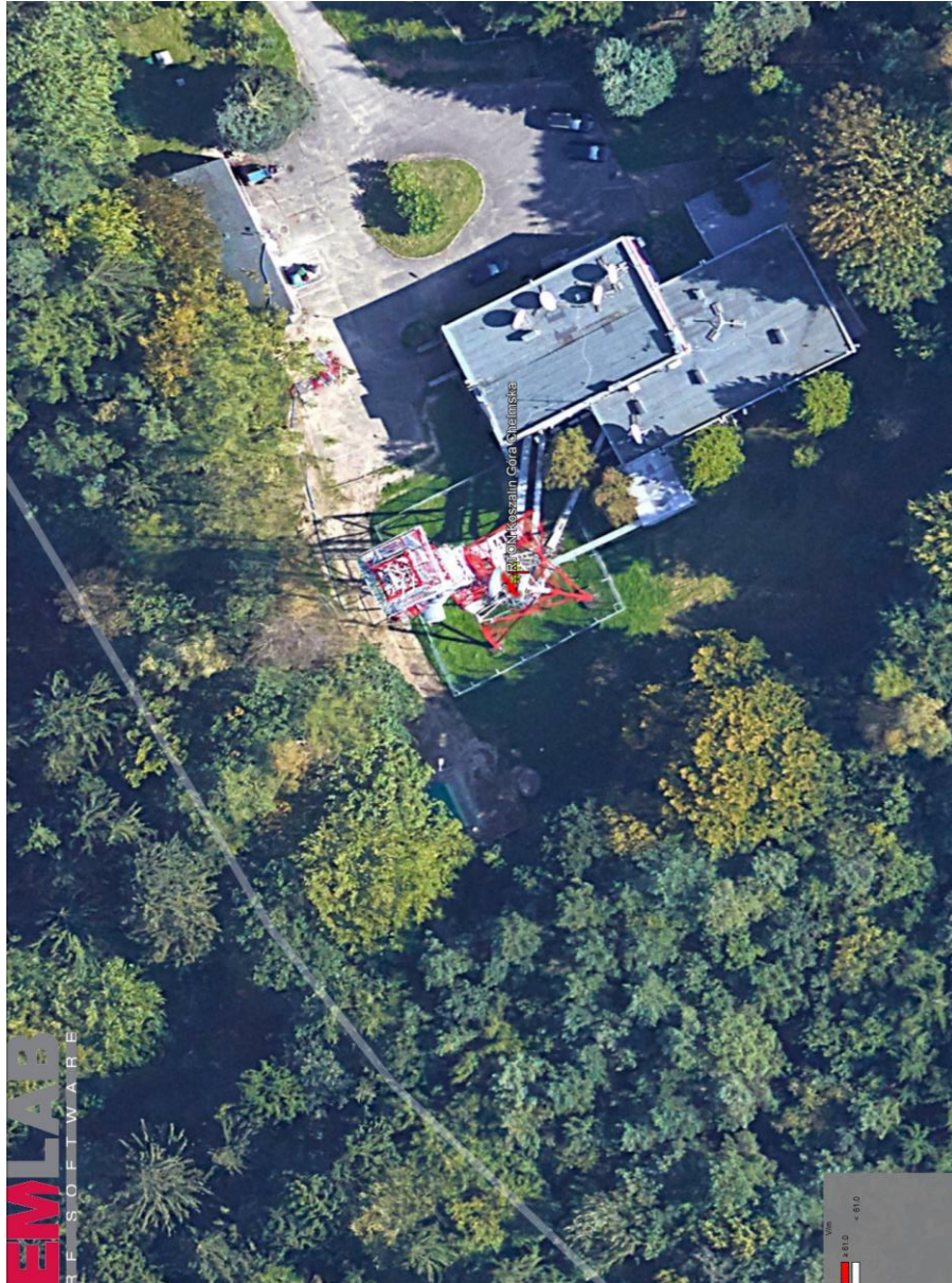
Rys. 2. Rzut poziomy rozkładu pola elektromagnetycznego anteny nowo projektowanej linii radiowej w otoczeniu RTON Koszalin / Góra Chelmska przewidzianej do zainstalowania na wysokości 62 m nad poziomem terenu.