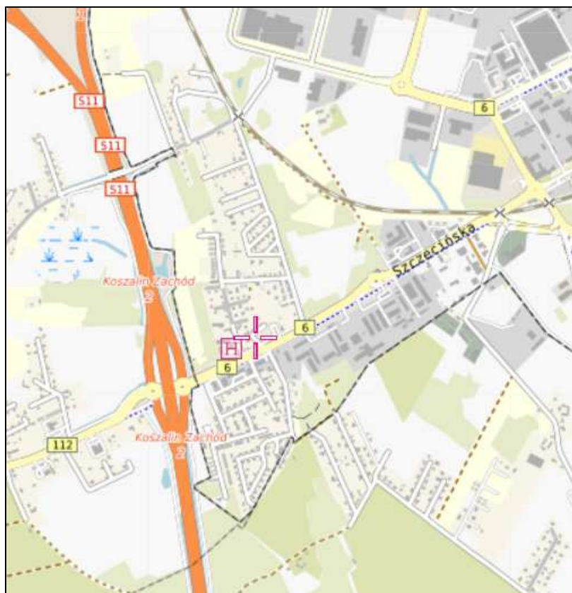
Rys. 1 Lokalizacja badanego obiektu