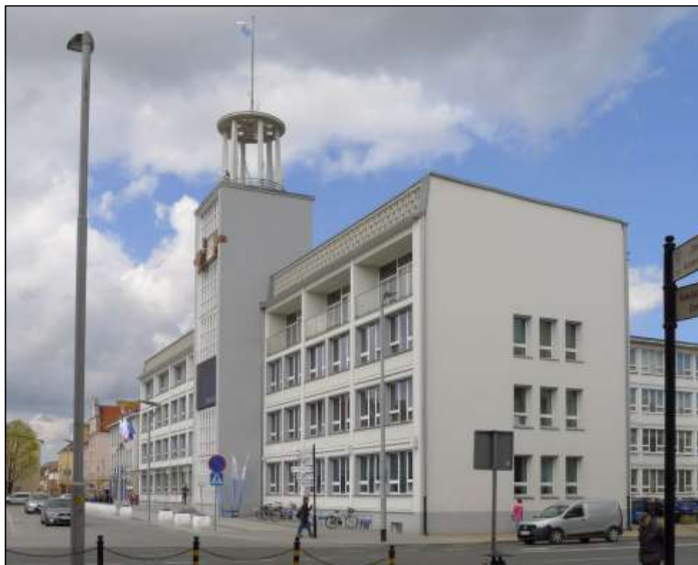
Widok na front budynku od strony południowo – wschodniej.