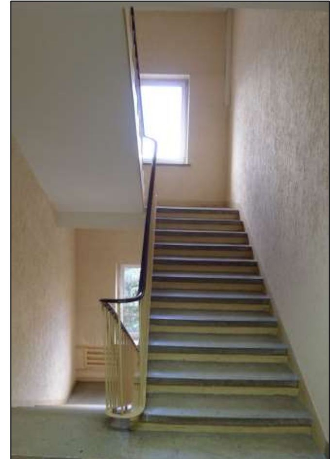
Skrzydło północne - klatka schodowa.