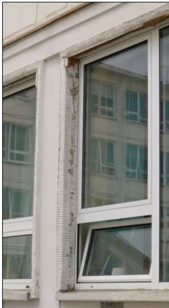
Opracowanie opaski okiennej.