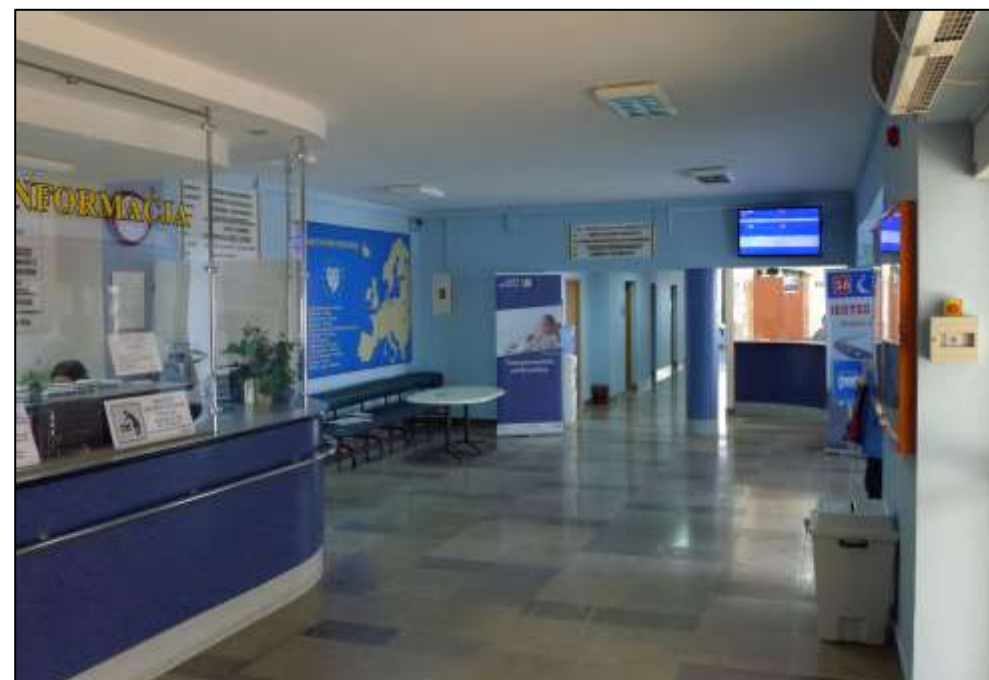
Parter – hol przy wejściu głównym.