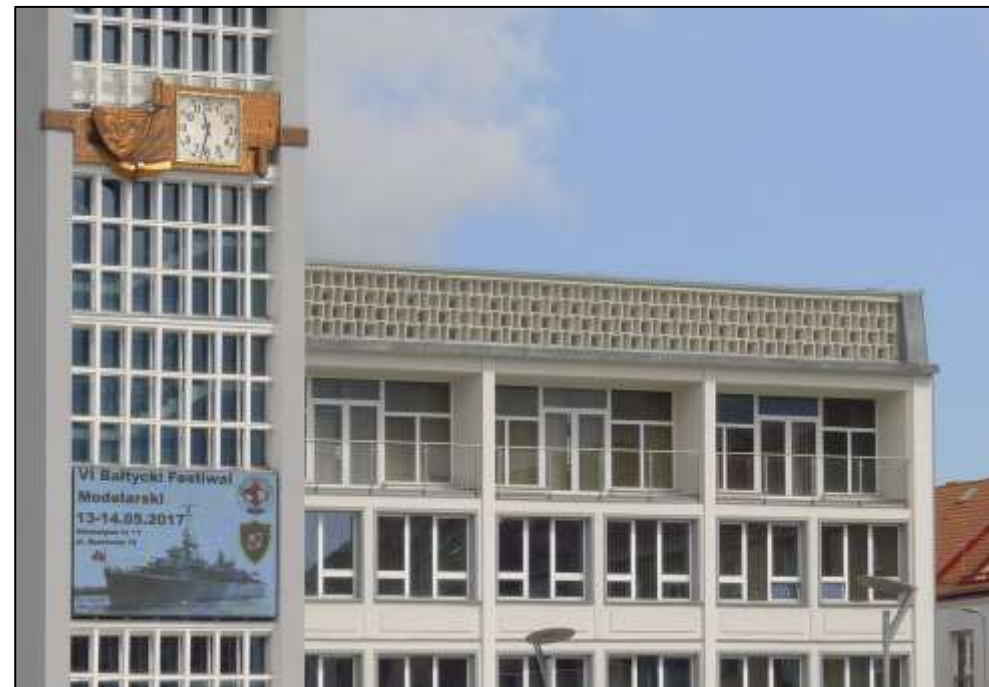
Elewacja frontowa po stronie wschodniej; widoczne balkony i attyka.