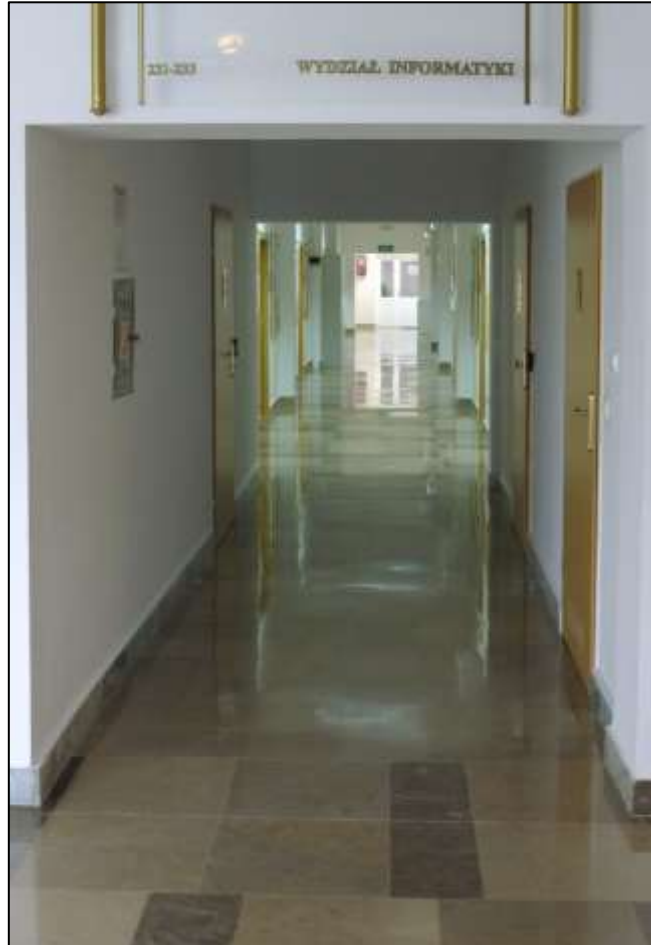
Skrzydło północne - korytarz II piętro.