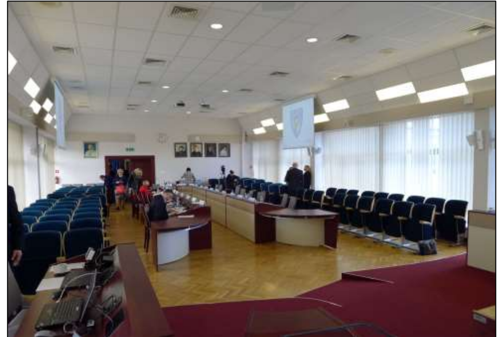
Sala konferencyjna III piętro.