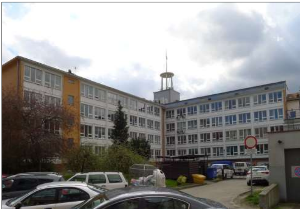
Widok od strony zaplecza na tylne elewacje skrzydła północnego oraz frontu.