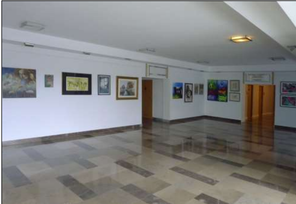
Hol przy głównej klatce schodowej II piętro.