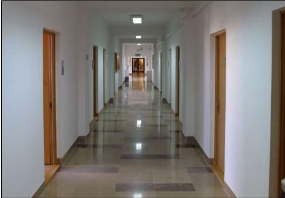
Budynek frontowy - korytarz III piętro.