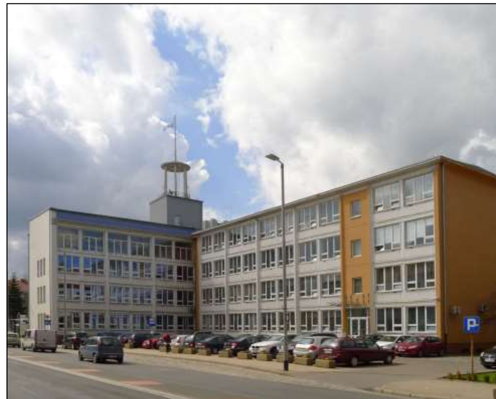
Widok od strony północno – wschodniej.