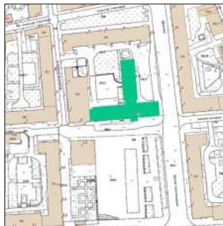
Plan sytuacyjny skala 1:3000