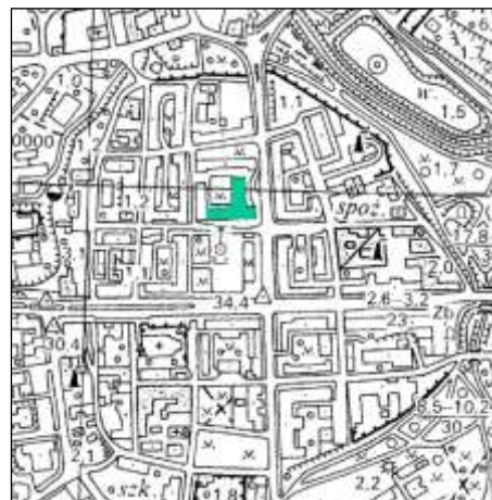
Plan orientacyjny skala 1:10 000