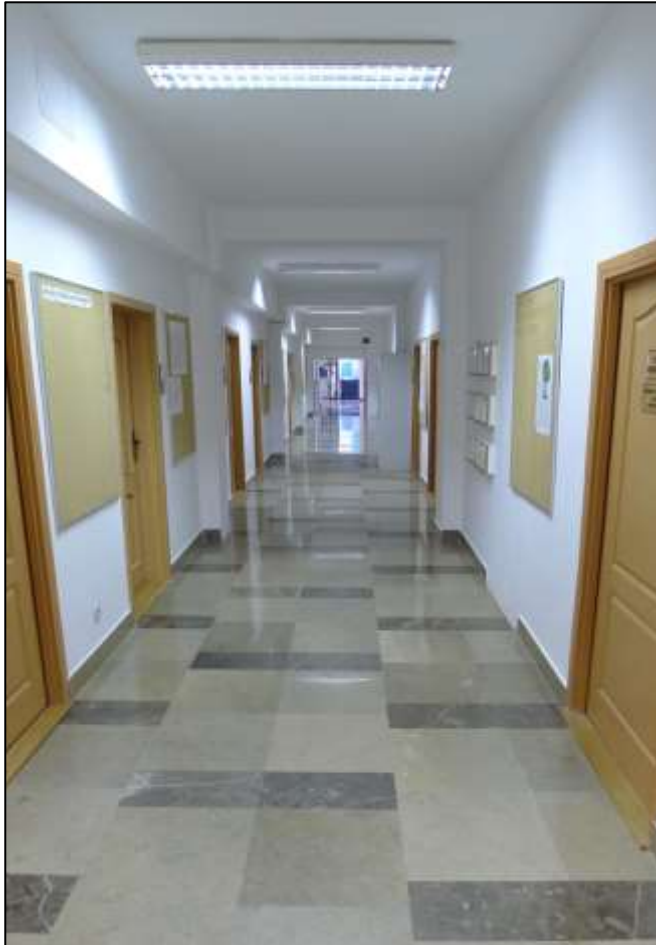
Budynek frontowy - korytarz II piętro.