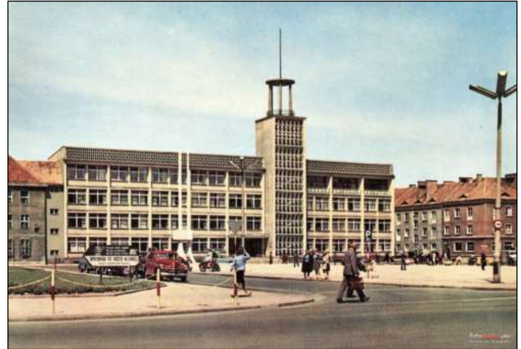
Archiwalna pocztówka z lat 1964-1966.